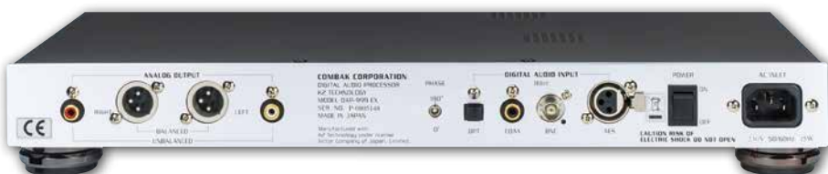
Vier Digitaleingänge, Ausgänge in Cinch und XLR, Phasenumkehrschalter – das war's

Upsampling: Die höhere Abtastfrequenz erlaubt den Einsatz flacherer Filter, die geringere Phasenprobleme verursachen.