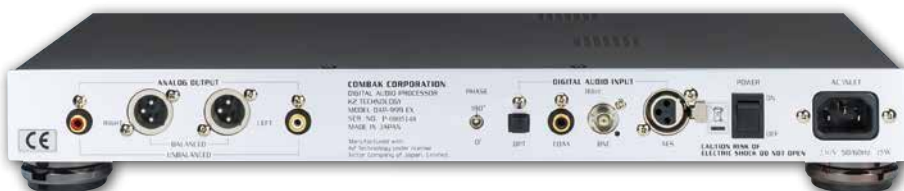
Vier Digitaleingänge, Ausgänge in Cinch und XLR, Phasenumkehrschalter – das war's

Upsampling: Die höhere Abtastfrequenz erlaubt den Einsatz flacherer Filter, die geringere Phasenprobleme verursachen.