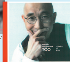
△ 盧冠廷 / Beyond Imagination Too CD/DVD