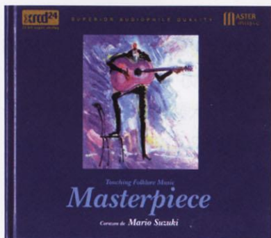
Masterpiece, NT001, 音橋