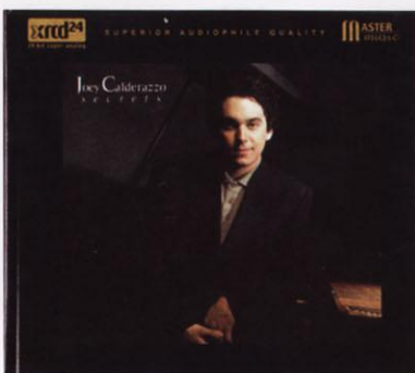
Secrets, NT002, 音橋