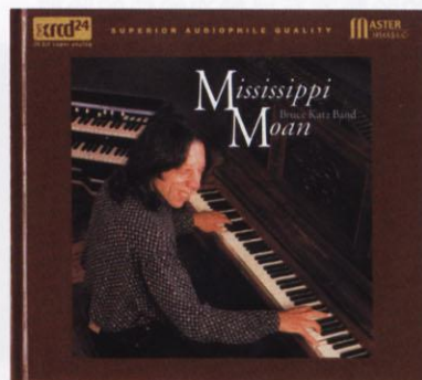
Mississippi Moan, NT006, 音橋