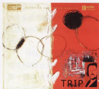
Trip, NT003, 音橋