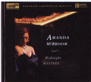
Midnight Matinee, NT005, 音橋